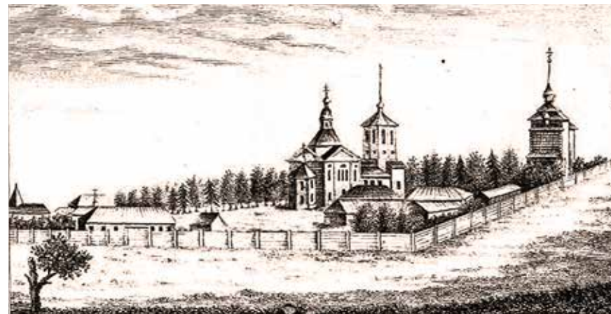
Усть-Киренский Свято-Троицкий монастырь. Литография XIX века

19 декабря 1690 года Ермоген почил, незадолго до этого приняв схиму. Братия похоронила старца за правым клиросом Троицкой церкви [3, л. 12]. Неутомимый подвижник, проведший всю свою земную жизнь в скитаниях, обрёл вечный покой.