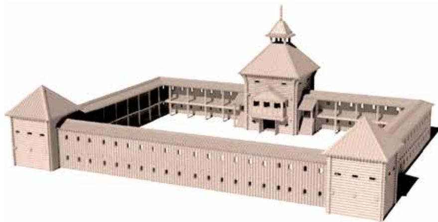
Албазинский острог в 1665–1682 гг. Реконструкция

Ермоген основал монастырь во имя Всемилоственного Спаса. Приказчик острога Пётр Осколков испросил для этого соответствующее разрешение от светской и духовной властей [13, с. 38]. Примечательно, что царский указ и архиерейское благословение на строительство монастыря албазинцы получили прежде, чем были удостоены государева прощения за убийство илимского воеводы и самовольное бегство на Амур. Таким образом, именно с основания монастыря началась легализация их положения.