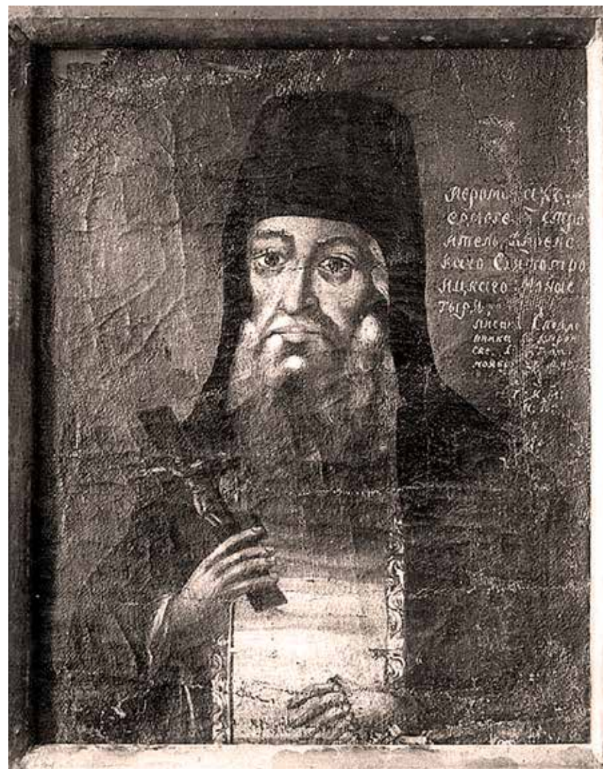
Портрет Еромогена XVIII века

Первое слово представляет собой рассказ о земной жизни Еромогена. Во втором слове собраны свидетельства его посмертных явлений и связанных с его почитанием чудес. Всего зафиксировано 27 таких случаев. Почти все они имеют точную датировку