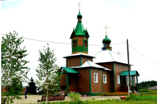
Храм Св Благовеоного Александра Невского в с. Игнатьево

Мемориальный кафедральный собор святого Александра Невского возведён в Болгарии в Софии в честь погибших воинов за независимость Болгарии во время русско-турецкой войны 1877-1878 г. Имя храма выражение благодарности болгар России и царю освободителю Александру II.