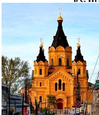
Собор в Нижнем Новгороде