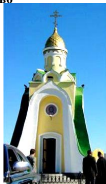
Часовня в Чите