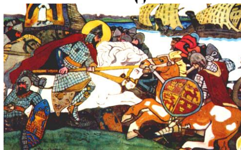
Рерих. «Александр Невский побеждает ярла»