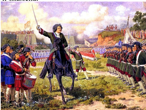
Пётр впереди Преображенского полка в качестве барабанщика

В Преображенском Пётр увлекался военными играми. Для таких игр, т.е. для потехи из мальчиков его ровесников были организованы потешные полки. На них были настоящие мундиры и знамёна.