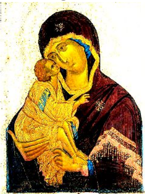
1390 г. Феофан Грек