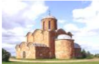
Церковь Спаса на Ковалёве